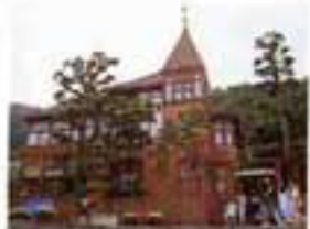
□ 異人館 風見鳥の館