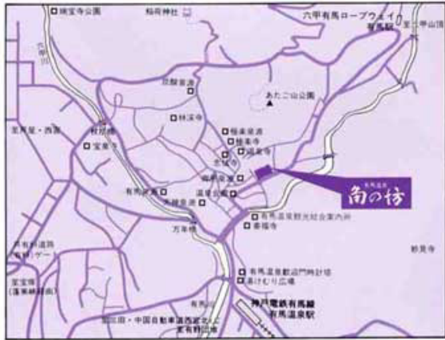
有馬温泉・角の坊